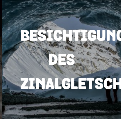
BESICHTIGUNG DES ZINALGLETSCH