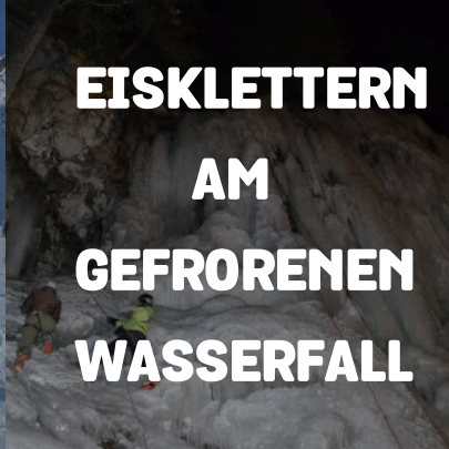
EISKLETTERN AM GEFRORENEN WASSERFALL