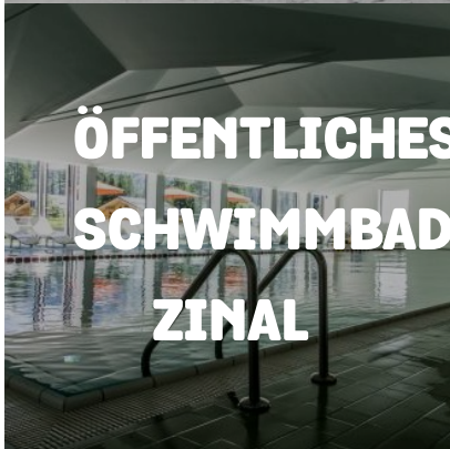
ÖFFENTLICHES SCHWIMMBAD ZINAL